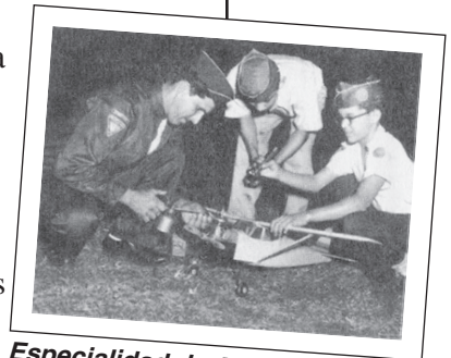
Especialidad de Aeromodelismo